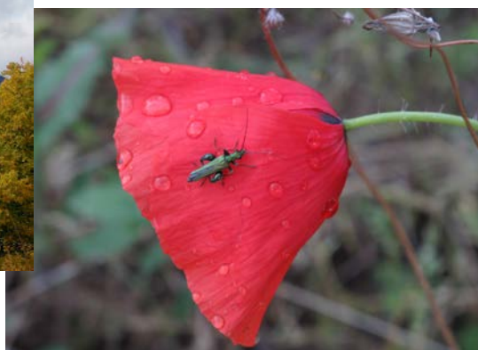
Oedemera nobilis (Núm. 2)