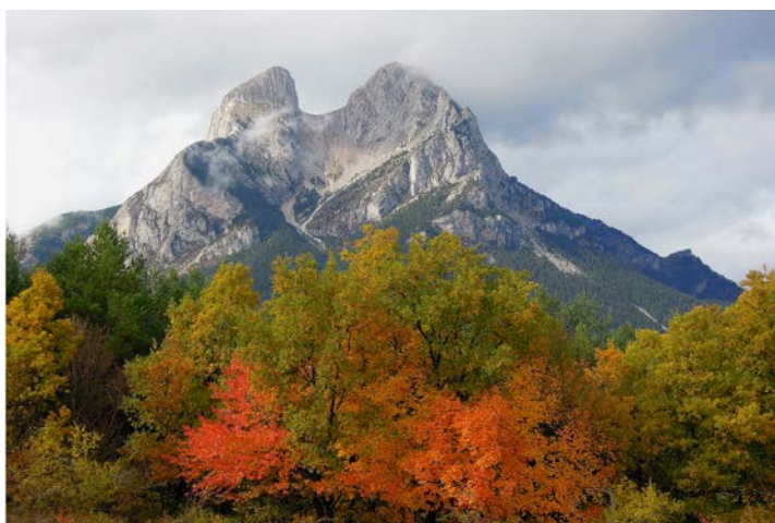
Tardor al Pedraforca (Núm. 1)

Algunes de les fotografies premiades (veure relació anterior)