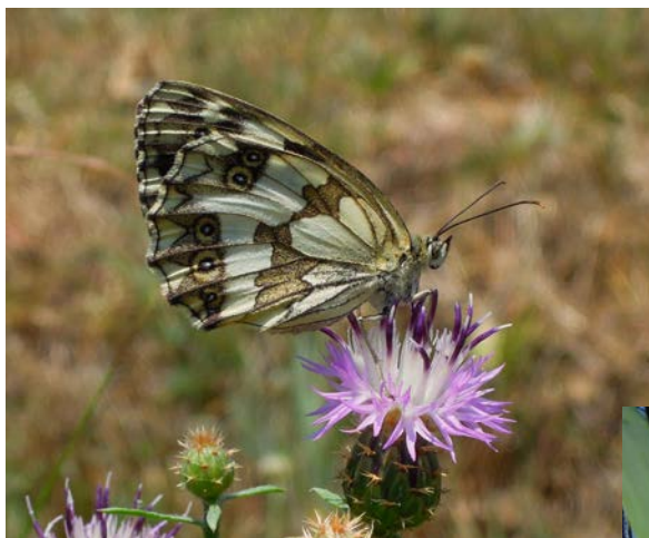
Papallona al card (Núm. 7)