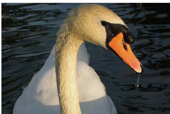
Cigne (Núm. 3)