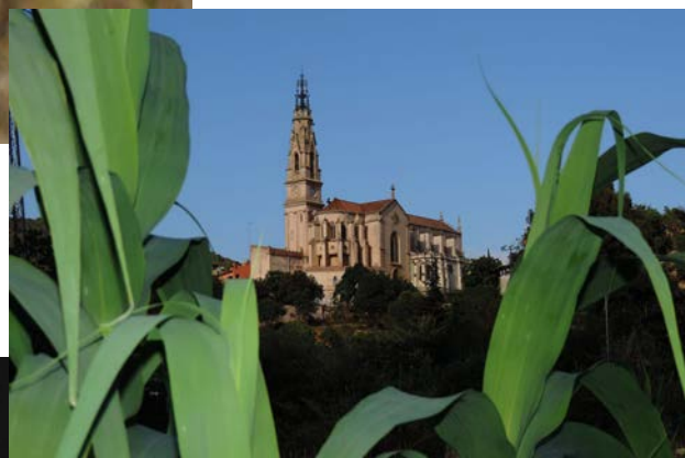
Catedral del Vallès (Núm. 8)