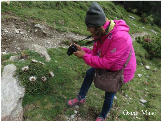
Retratant cardigueres ( Carlina acaulis ) al santuari de Núria (Ripollès)