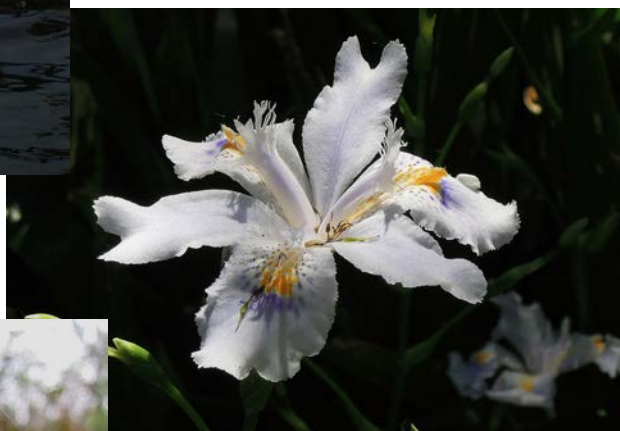
Flor blanca (Núm. 4)