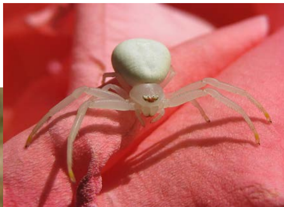
Misumena batia (Núm. 6)