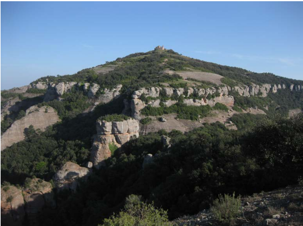
La Mola és el sostre i la muntanya més emblemàtica i representativa de tot el massís de Sant Llorenç del Munt i l'Obac

digmàtic, ja que per poder recórrer a peu valls, carenes i muntanyes s'han hagut de crear camins (o bé aprofitar els que ja existien amb altres finalitats) i, en molts casos, senyalitzar-los. En quant a l'escalada, algú crea rutes o vies d'escalada i té l'opció de deixar col·locades (o no) assegurances per tal de poder ser repetides o bé per a dotar-les d'una seguretat més o menys elevada. El cas de l'espeleologia és similar al de l'escalada, sobretot pel que fa al descens d'avencs, ja que en molts casos s'han de muntar instal·lacions artificials i fins i tot eixamplar passos estrets. Sigui com sigui, totes aquestes accions impliquen una modificació important del medi natural i un desgast posterior produït pel pas de les persones.