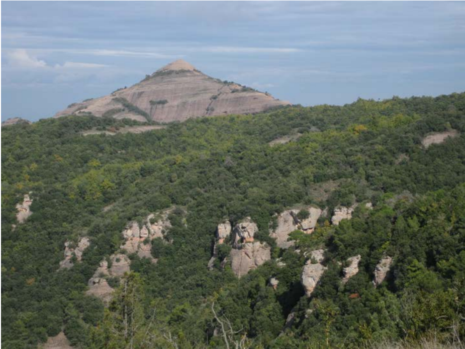
El piramidal i rocós Montcau és un dels cims més destacats de Sant Llorenç del Munt.

d'arreu de Catalunya i més enllà, però sobretot dels de l'estimat Sant Llorenç del Munt i l'Obac. És per això que després d'escriure diversos llibres on no ha estat el protagonista principal, vaig tenir la il·lusió de retre-li un homenatge i ampliar l'extens catàleg bibliogràfic del massís amb l'aportació dels humils coneixements que tinc sobre els elements geogràfics que més m'atreuen: els cims.