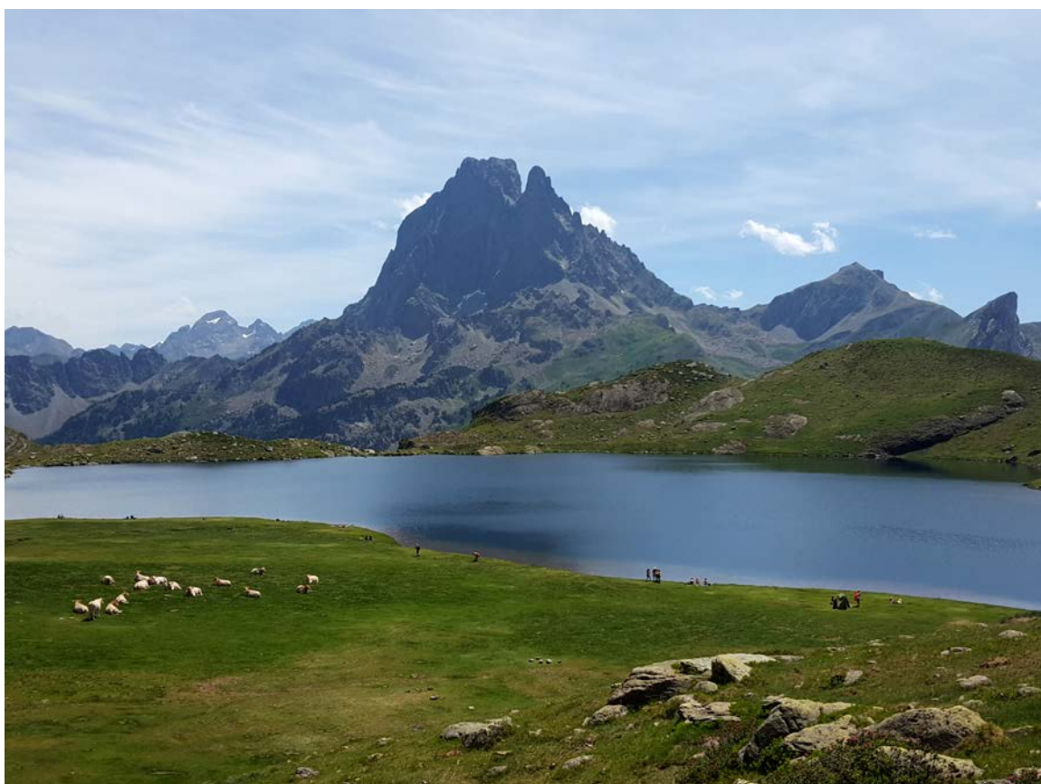
El símbol del Pyrénéa Sports: el Pic du Midi d'Ossau (Mieidia d'Assau) vist des del refugi d'Ayous.

Amb l'esclat de la 2a Guerra Mundial, França s'hi va veure implicada de ple. Això no va suposar pas un impediment pel jove club, que en poc temps va anar virant vers les disciplines alpines. L'any 1940 fundaren una secció femenina de muntanya que es va inscriure a la Secció de Pau del Club Alpí Francès (CAF), i a causa de la proximitat dels Pirineus dissenyaren el logotip