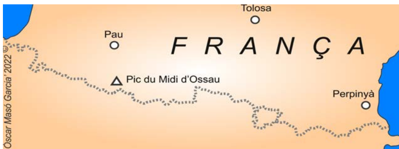
Mapa d'ubicació de topònims citats. Autor: Òscar Masó Garcia.

Text: Òscar Masó Garcia ( https://masogarcia.com )