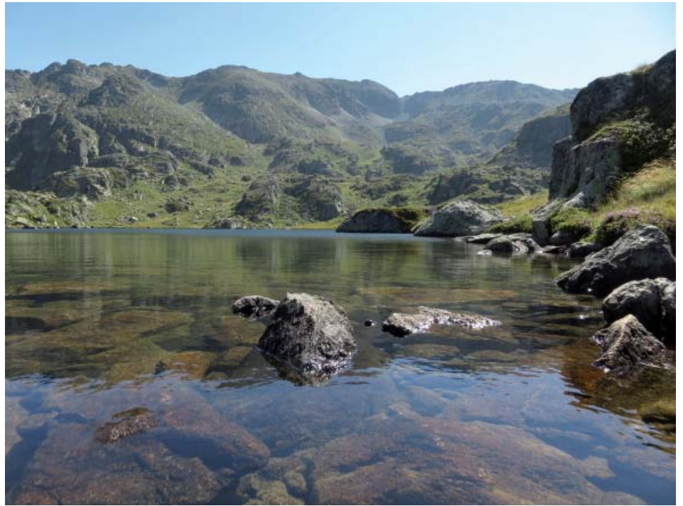
El formós estany de la Peyre amb el pic Mirabail al fons.

sem al marge esquerre (oest) i remuntem sense camí per entre nerets, roques i rierols, en direcció als estanys. Un tram molt penós de torrent encaixonat entre blocs du a una petita vall més amable amb un estanyol i alguna fita anecdòtica. Seguim el curs de l'aigua i passat un caos de roques arribem, al cap d'una hora llarga, a l'estany allargassat des Castellasses (2254 m). És el més gran dels dos, on la quietud i la calma senyoregen en un ambient envoltat de pendents de roca i herbes. El revoltem per l'esquerra i remuntem al sud la vall per un