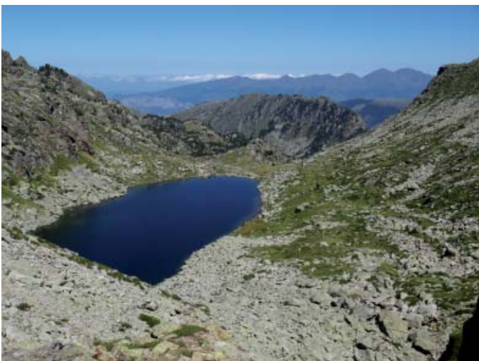
L'estany des Castellasses.

Seguim els rastres de camí i fites al marge dret del riu durant una hora fins que arribem a la cabana de les Pradettes, senzilla i apta per a dormir-hi si s'escau. Prosseguim pels prats i meandres de la vall fins que als 15 minuts pas-