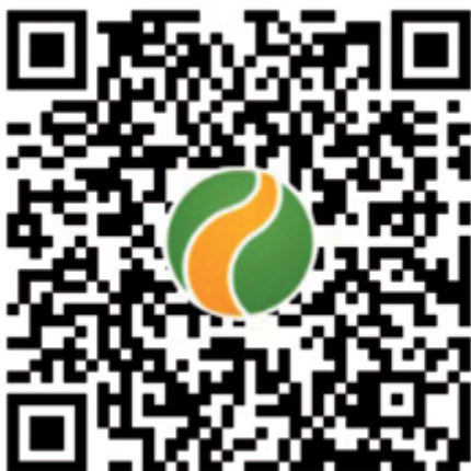
QR d'enllaç al track de Wikiloc

No ha estat fins fa poc que he anat a visitar aquests estanys, esmerçant-hi una sola jornada que ha suposat molts quilòmetres i un fort desnivell, amb l'afegit del pic de Riet, un cim pràcticament desconegut però amb una panoràmica privilegiada, a més del preciós estany de la Peyre. Tot plegat ha suposat una experiència exigent i meravellosa a més de curiosa, gratificant i farcida d'una profunda soledat i salvatgia. Qui vulgui experimentar-ho l'invito a fer-ho a través de les modestes indicacions d'aquest text. Ruta: Central de Laparan - vall de Quioulès - Coma de Jas - estany des Castellasses - estany