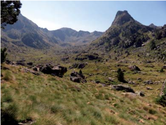
La vasta i solitària Coma de Jas, amb el Pic de Cabaillère al fons