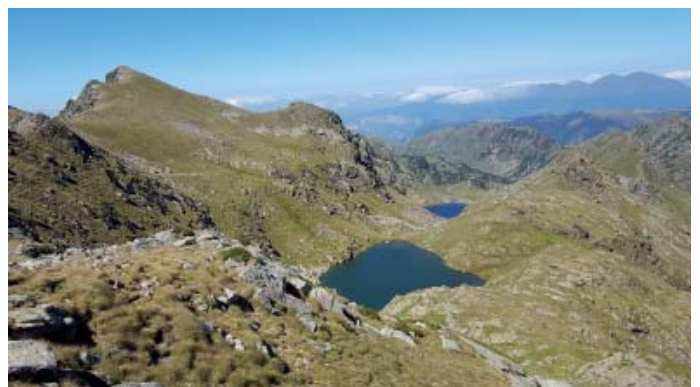
El pic de Riet a l'esquerra, amb l'estany Negre des Castellasses en primer terme i l'estany des Castellasses al fons