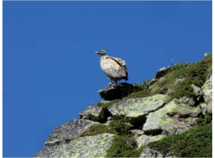
Voltor esperant-me al cim del pic de Riet

Negre des Castellasses -pic de Riet - estany de la Peyre - retorn.